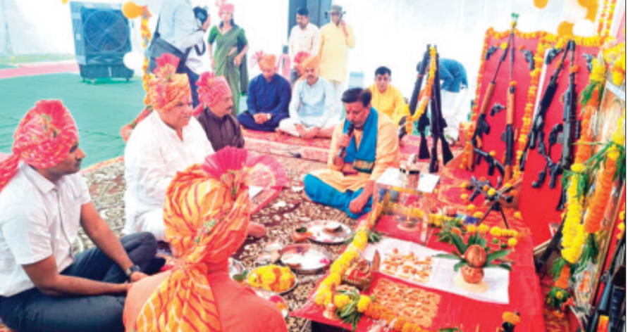
हरिभूमि न्यूज | सीहोर