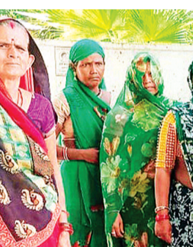
ललितपुर। शहर के मोहल्ला नेहरूनगर में रहने वाले लोगों ने बताया कि नेहरू युवा केन्द्र रोड काफी मॉडर्न है। एव पानी पाइप लाइन पर दबंगों द्वारा अवैध निर्माण किये जाने का आरोप लगाते हुये इसे रोके जाने की मांग उठायी है। इस