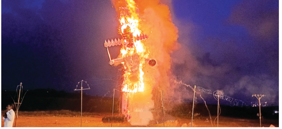
हरिभूमि न्यूज | कानड़

अधर्म पर धर्म की जीत असत्य पर सत्य की विजय का प्रतीक विजयादशमी का पर्व नगर में गुरुवार को हर्षोल्लास के साथ मनाया गया। इस वर्ष 41 फिट के रावण के पुतले का दहन परंपरा अनुसार किया गया। दहन के पूर्व दशहरा मैदान श्रीराम के जयकारों से गुंज उठा अधर्म पर धर्म की जीत को देखने के लिए भारी संख्या में लोग आए दहन के पूर्व रावपुरिया रोड स्थित खेल ग्राउंड दशहरा मैदान पर रंगारंग आतिशबाजी की गई।