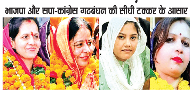
भाजपा और सपा-कांग्रेस गठबंधन की सीधी टक्कर के आसार